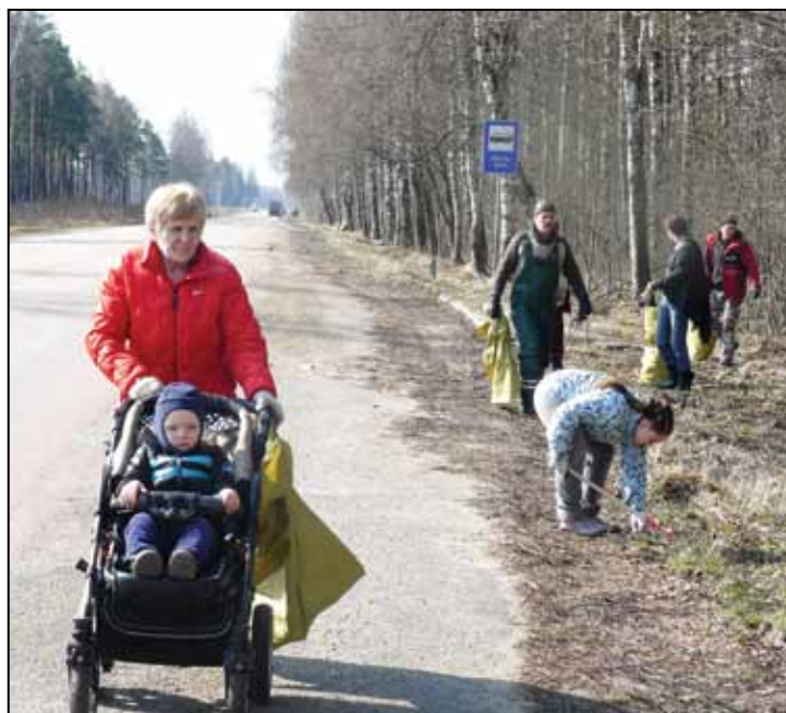
► turpinājums no 4. lpp.